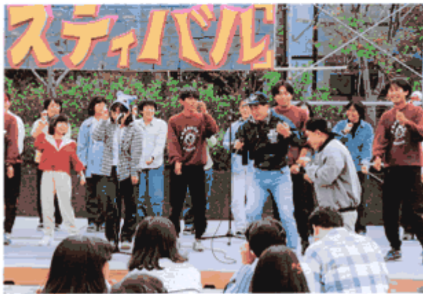
皇学館大学学園祭に参加

くれたり、学生のように「ちよつとハラハラドキドキ」させてくれる友人や兄弟恋人のような気持ちにさせてくれたり、警戒心の強い仲間も小学生と一緒にのびのびとしてパットと顔が明るくなった。そんなボランティアの皆さんにお願いしたい事は「待つ事」です。一見冷たそうに見えてしまう「待つ事」が大切なのです。「したる」「やったる」「大変そう」「かわいそう」は、仲間の今までの努力を台無しにしてしまいます。仲間が「自分で動く」「自分で話す」まで待つて下さい。