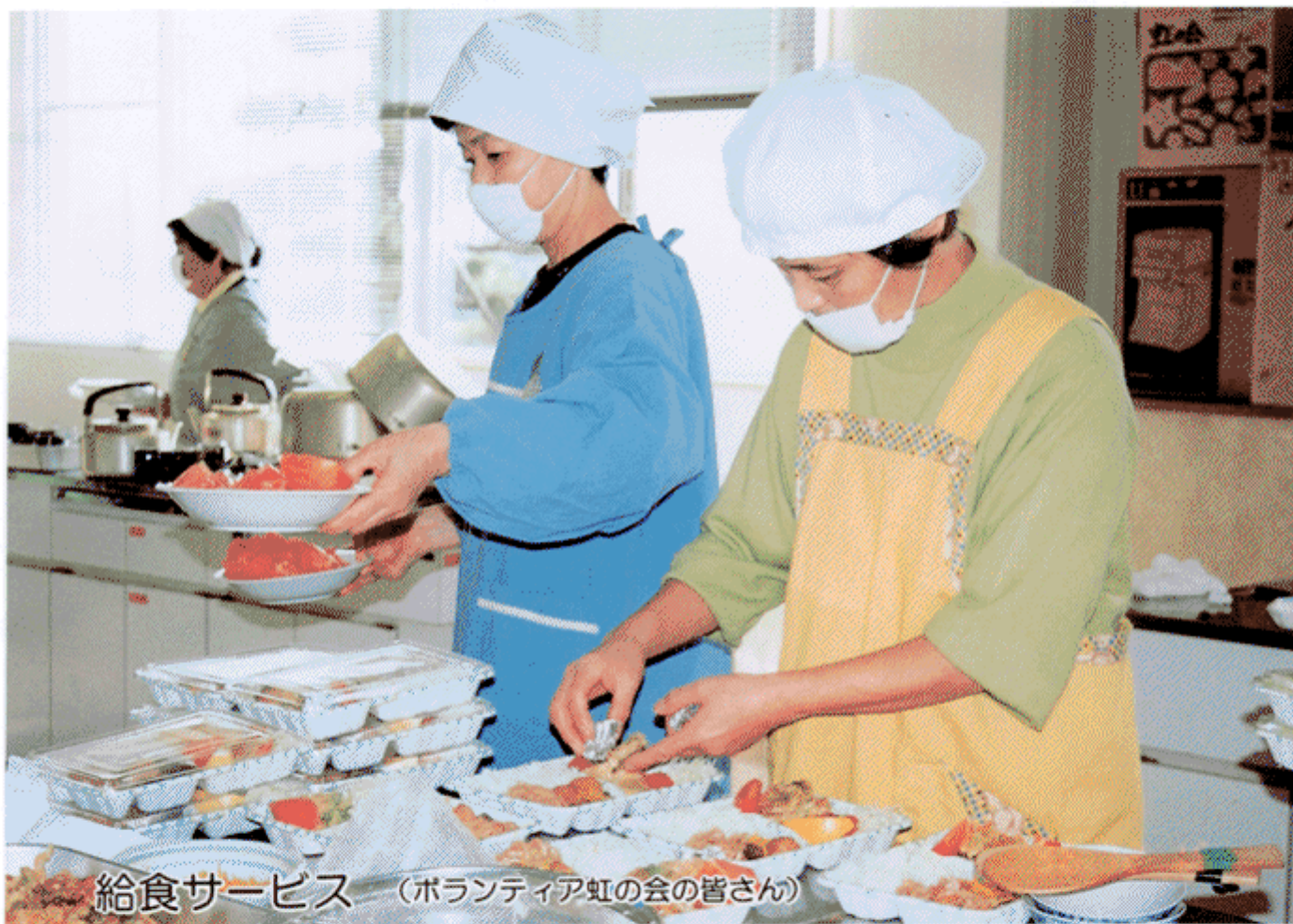
給食サービス (ボランティア虹の会の皆さん)

編集：発行 社会福祉法人 玉城町社会福祉協議会 玉城町田丸114-3 TEL & FAX 059658-6915