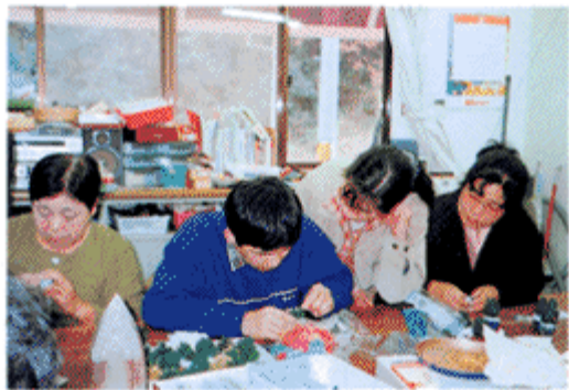
作品づくり介助（夢工房にて）

氏が選ばれました。会員24名での出発です。玉城町では、すでに3つのグループが社協に登録し、活躍していただいています。色々な方面でボランティアの手助けが必要となつてきています。ボランティアに興味のある方（特に男性で配達して下さる方大歓迎）社協までご連絡下さい。