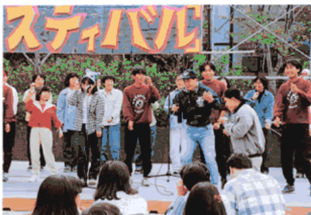
皇学館大学学園祭に参加

くれたり、学生のように「ちよつとハラハラドキドキ」させてくれる友人や兄弟恋人のような気持ちにさせてくれたり、警戒心の強い仲間も小学生と一緒にのびのびとしてパットと顔が明るくなった。そんなボランティアの皆さんにお願いしたい事は「待つ事」です。一見冷たそうに見えてしまう「待つ事」が大切なのです。「したる」「やったる」「大変そう」「かわいそう」は、仲間の今までの努力を台無しにしてしまいます。仲間が「自分で動く」「自分で話す」まで待つて下さい。