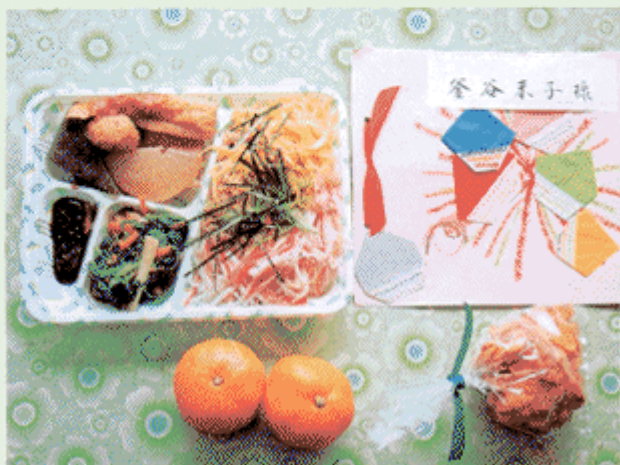
出来あがったお弁当とお便り