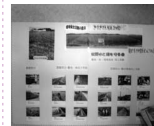
蚊野区 (コスモス苗の配布もありました)