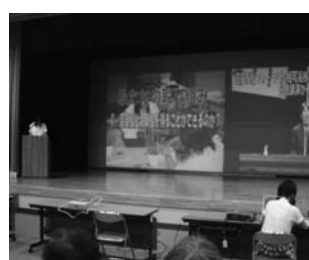
園芸福祉の取り組み、すばらしい!