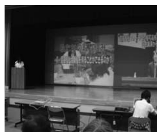
園芸福祉の取り組み、すばらしい!