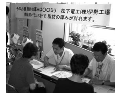
松下電工の皮下脂肪測定は、人気コーナー