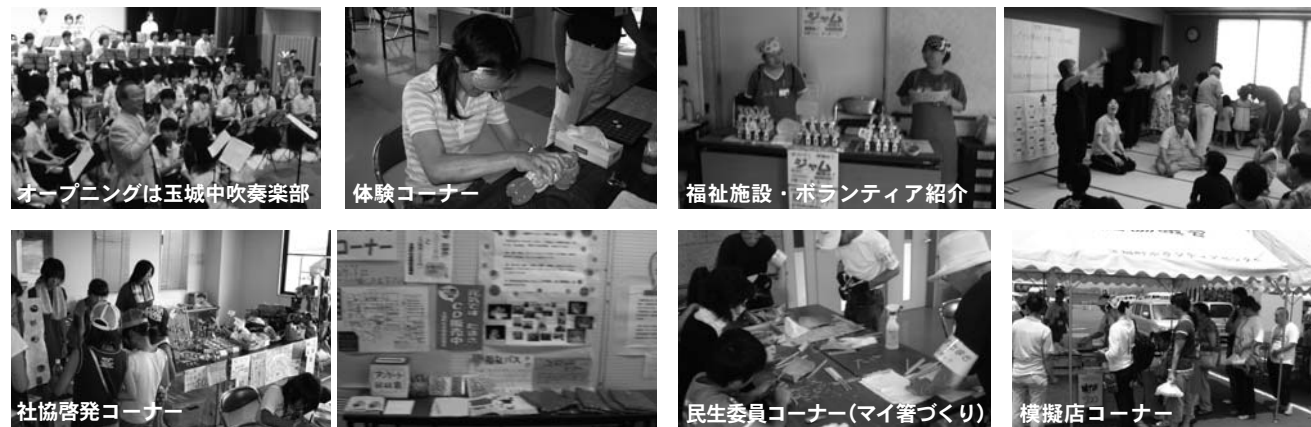
オープニングは玉城中吹奏楽部