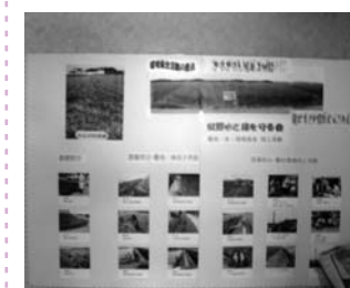
蚊野区 (コスモス苗の配布もありました)