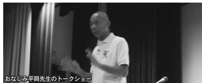
おなじみ平岡先生のトークショー