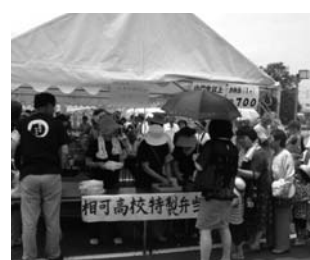
お弁当販売に長蛇の列