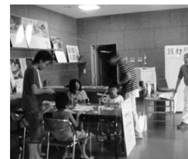
京セラ 健康づくり推進事業者発表ペーパークラフトコーナー