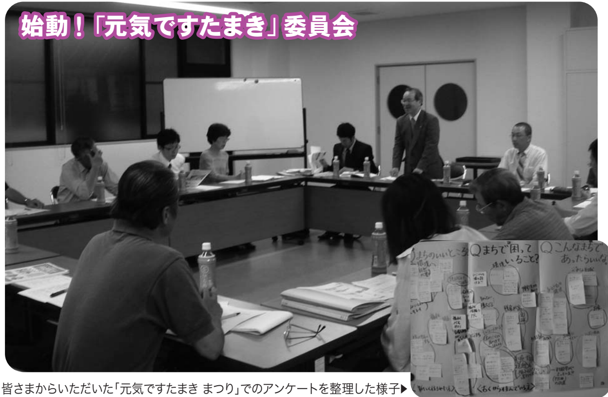
始動！「元気ですたまき」委員会