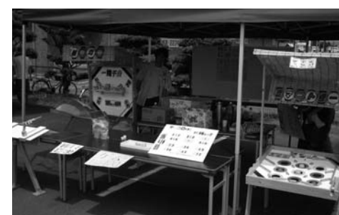
新明産業 夢工房たまきと一緒にゲームコーナー