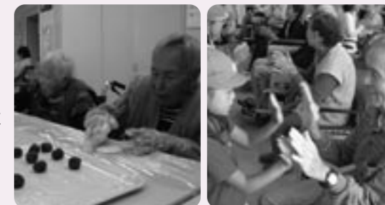
あんまん作り ホコホコ。 あ～おいし。