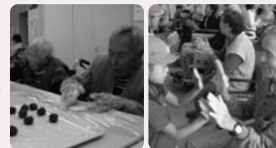
あんまん作り ホコホコ。 あ～おいし。