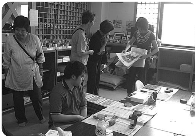
作業の様子を熱心に見学する保護者

9月16日(木) 滋賀県にある知的障害者授産施設とグループホームへ通所者と保護者がボランティア「虹の会」さんも同行して視察研修を行いました。 同じさをり織りを扱う施設の見学は、通所者の仕事への意欲を刺激し、研修後の作業が活気付くようになりました。