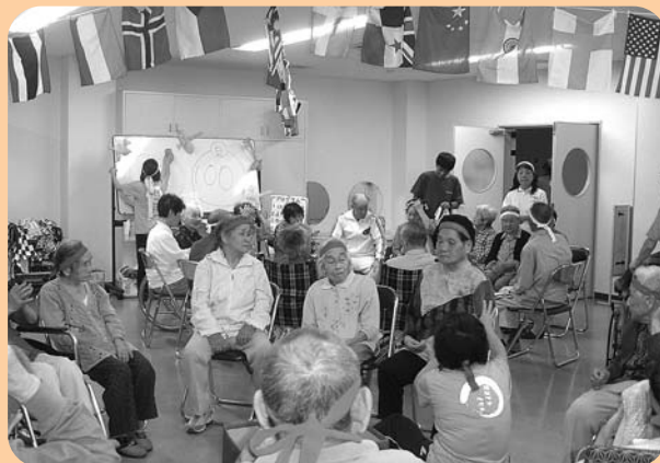
運動会を楽しむ利用者