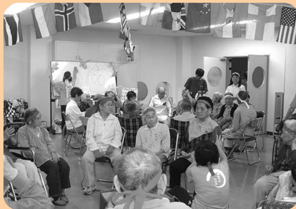
運動会を楽しむ利用者