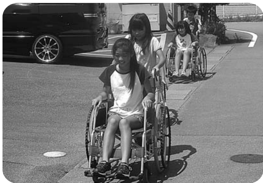
車いす体験の様子