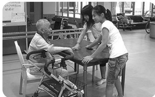
高齢者施設で体験する児童

町の福祉について学び、その後各グループに分かれて町内高齢者福祉施設においてふれあい体験を行いました。子供たちは、積極的に施設の利用者の方や職員に話しかけ、交流を楽しんでいました。