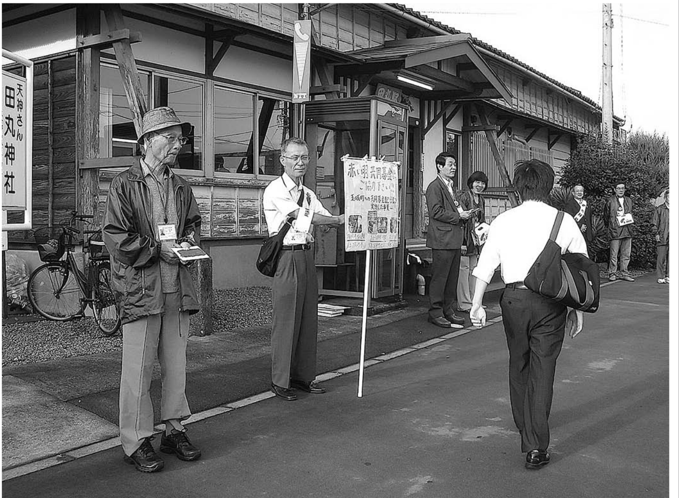
田丸駅での募金活動