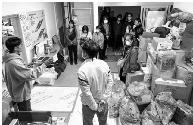
輪島市社協との情報共有

3日間で技術系ボランティアと協働し被災した住宅の泥かきや清掃、災害ボランティアセンターの運営支援を行いました。