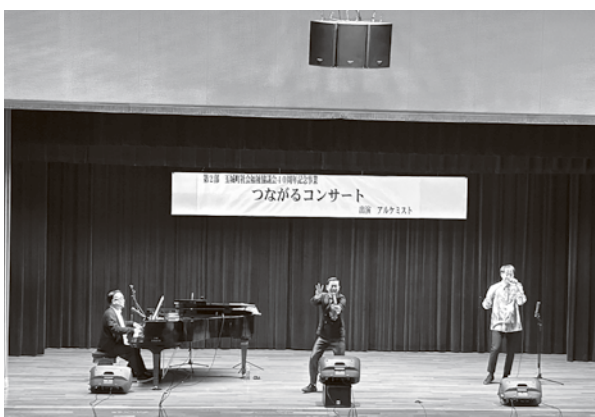
つながるコンサート