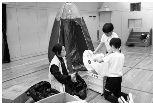
簡易トイレ組み立て体験