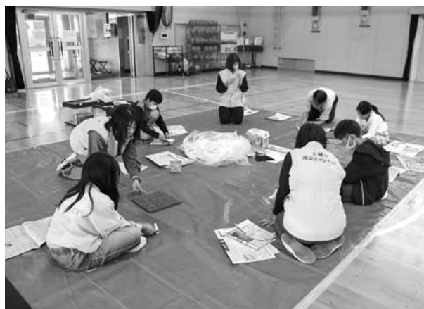
新聞スリッパづくり

今後子ども達及び地域住民の防災意識の向上のため活動に取り組んで行く予定です。ご興味・ご関心をお持ちになられた方は玉城町社会福祉協議会（☎58-6915）までお気軽にお問い合わせください。