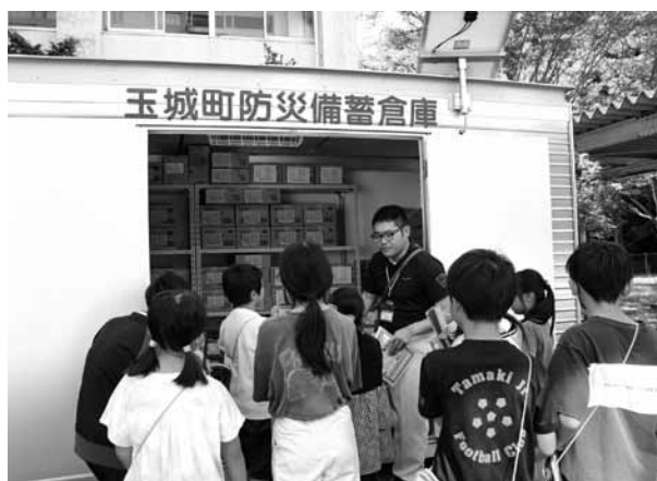
防災備蓄倉庫見学