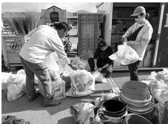
災害ボランティアセンターの資器材整理