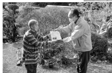
歳末まごころ訪問