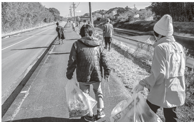
わが町クリーンアップの様子