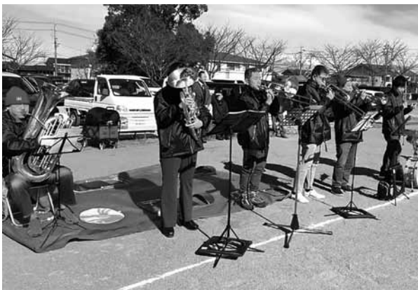
ファンファーレの様子

一般社団法人 たまき文化スポーツクラブ等が主催する「玉城健康マラソン」が12月7日、町お城広場で行われました。