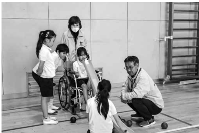
ランプ（勾配具）を使った体験