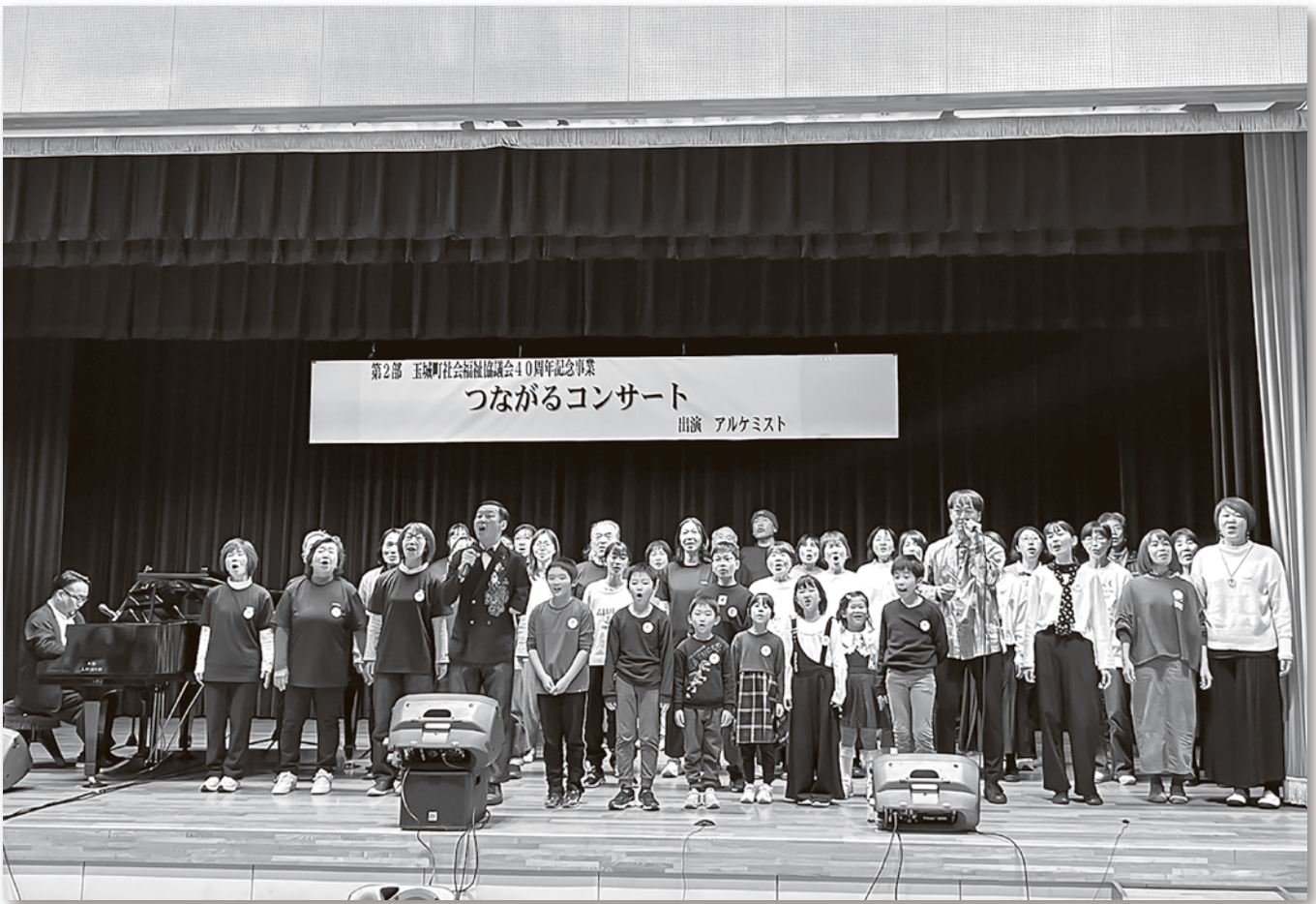
アルケミスト合唱団