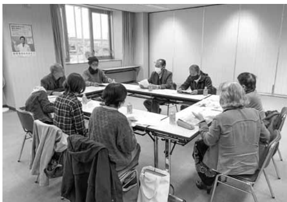
川越町民児協との交流の様子

川越町民児協のみなさんとは各町の違いや自分の町でできることを考えるきっかけとなる意見交換が行われました。