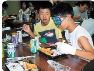
アイマスクをした食事体験