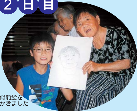
似顔絵をかきました

利用者のおじいちゃん、おばあちゃんとシーツゲーム等で仲良くなり最後に似顔絵を描きながらたくさんお話しました。