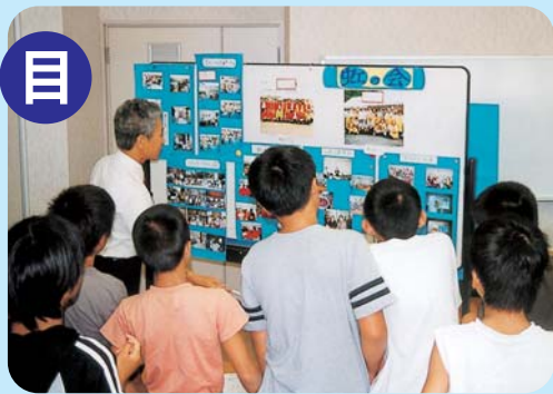
ボランティアとはなぐに？

活動されている方にボランティアとは何か、また体験談を聞かせていただきました。 『手話』に挑戦し、言葉の障害を超えることができることを体験しました。