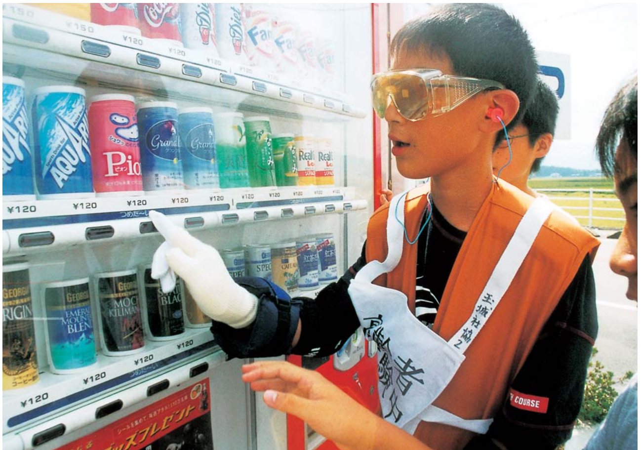
高齢者擬似体験 ジュース買うのも大変なんだネ。