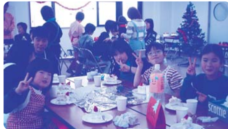
▲手作りケーキといっしょに (12月)