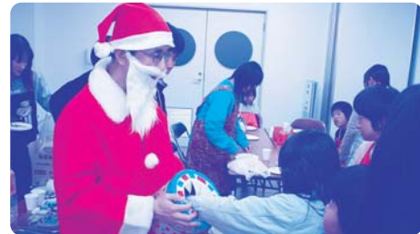
▲サンタさんからプレゼント (12月)