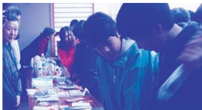
▲ボランティアグループ「玉城防災ボランティア」による非常持出用具のおはなし