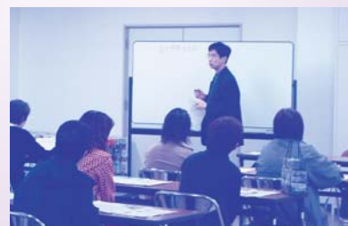
▶ユニバーサルデザインチームの講義を聞き参加者のみなさん