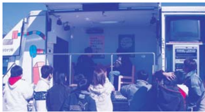
▲地震体験車による体験学習