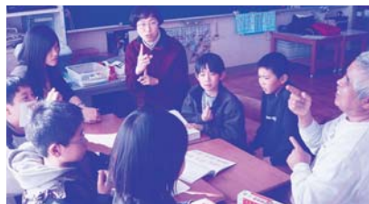
▲ボランティアグループ「手話おしゃべり会」と障害を持った方と手話交流