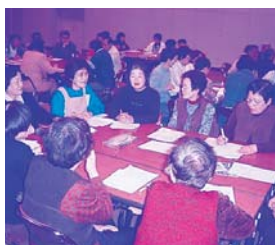
▲救援シミュレーションで熱心に意見を出していただきました。

大規模地震の発生に備え、地震に対する意識の向上や赤十字の医療全般について理解を深めていただくことと赤十字防災講座を玉城防災ボランティアと一緒に開催いたしました。