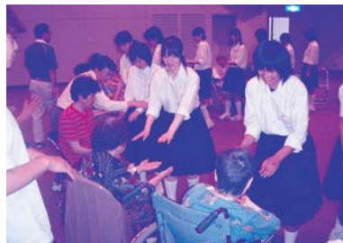
▲介護保険施設「玉城町デイサービスセンター」で利用者とのレクリエーション