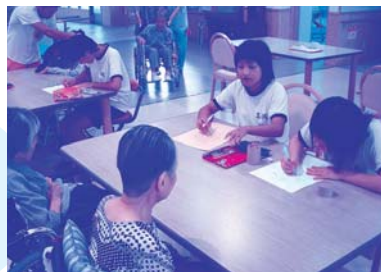
介護保険施設「はなのその」の見学、利用者とのレクリエーション