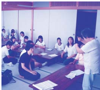
▲ボランティアグループ「手話おしゃべり会」と障害を持った方と手話交流