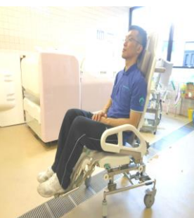
専用車いすで入浴