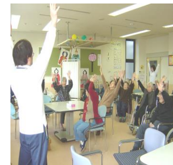
元気ですたまき体操