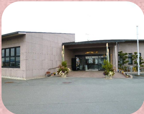
玉城町保健福祉会館内

送迎、創作活動、機能運動 給食サービス、入浴サービス 食事、排泄等の生活支援 健康チェック